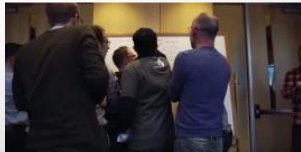
Creando soluciones Fintech con BBVA