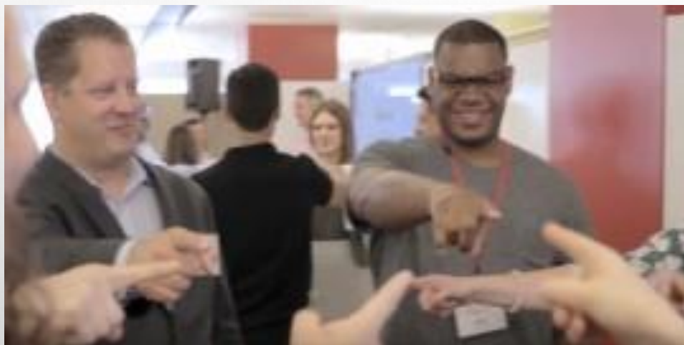
Intel & Startup Weekend